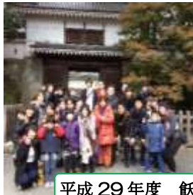
平成 29 年度 飫肥城跡散策 & 名物『おび天』他☆バスツアー