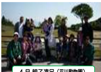
4 月 親子遠足 (平川動物園)