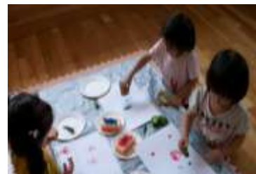
子育て中の方でも安心して働ける様に… 保育士がお預かりします。