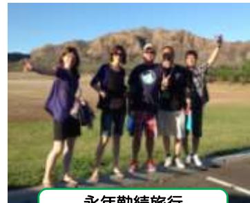
永年勤続旅行 (ハワイ)