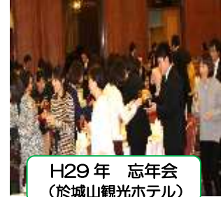
H29 年 忘年会 (於城山観光ホテル)