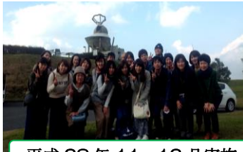
平成 28 年 11・12 月実施 鹿児島再発見の旅☆バスツアー