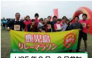
H25 年 3 月、6 月参加