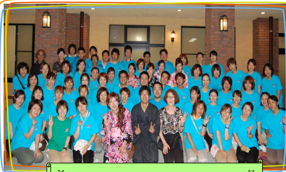
✌️ パソ・デ・サマーフェスタにて記念撮影 ✌️

やる気があり、真面目に勤務して頂いてる方には一定の資格取得後は正規職員の登用を行っております。 是非、医療・福祉のプロと一緒に働きましょう！