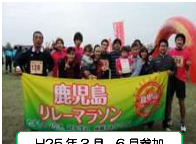
H25 年 3 月、6 月参加