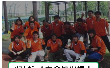
ソフトボール大会に出場!