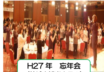
H27 年 忘年会 (於城山観光ホテル)